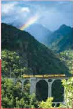
Le Train Jaune