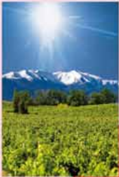
Le Canigou Têres Neiges