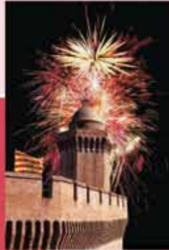
Perpignan Le Castillet